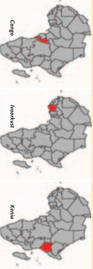
Vormgeving: Studio Vermaas, Driebergen

tureel en intellectueel). De verspreiding van het evangelie en de daarmee gepaard gaande groei van gemeenten wereldwijd is exponentieel: de groei van training van leidend kader in die gemeenten is in het meest gunstige geval lineair. Om die reden stelt BEE International zich voortdurend tot doel om zo snel en systematisch als mogelijk de groei van dienend leiderschap in de nieuw testamentische gemeente te bevorderen.